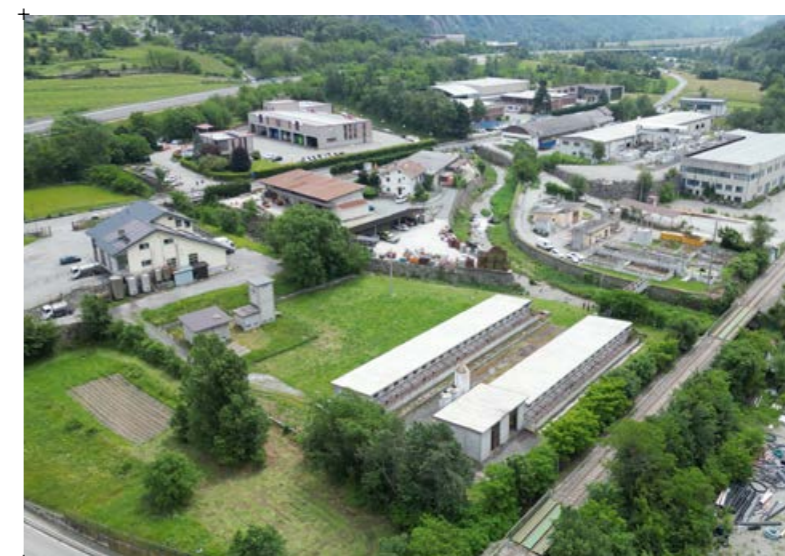
2// vista aerea dei due manufatti