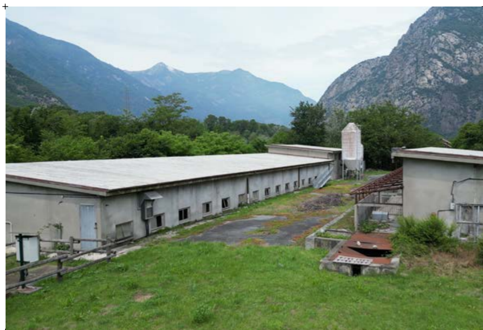
2// vista degli edifici e gli spazi aperti nel contesto naturale