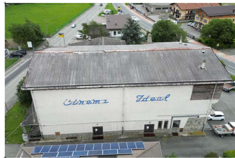
4// fotografia dell'edificio e gli spazi esterni