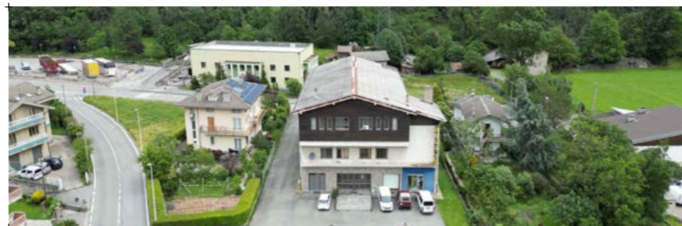
2// fotografia dell'edificio nel contesto urbano