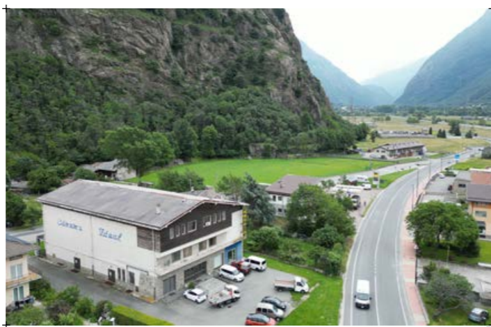
3// fotografia scattata dal Nord-Ovest