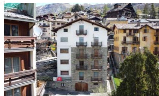
2// fotografia dell'edificio visto da Sud