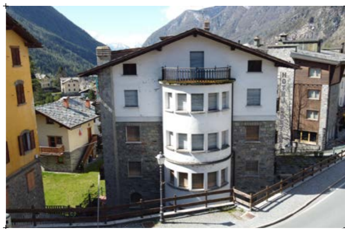
3// fotografia ripresa da Nord