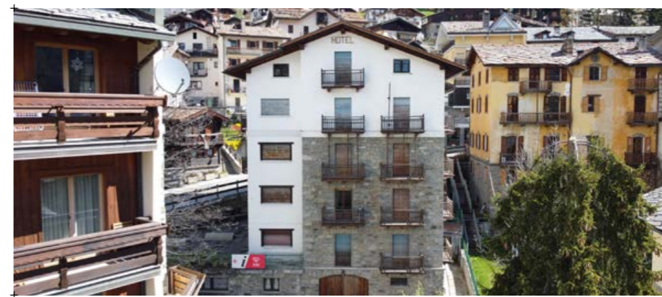
5-6// fotografia dell'edificio nel contesto urbano