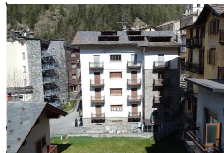
4// fotografia della facciata ovest dell'edificio