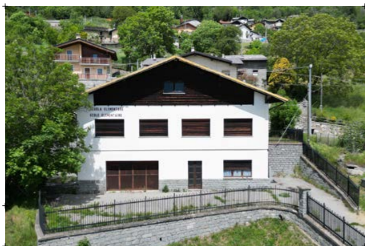
1// fotografia dell'edificio con lo sfondo paesaggistico 2// facciata principale 3// fotografia della scuola dove si vede la relazione con i fabbricati residenziali attorno