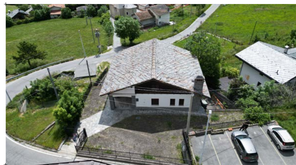
4// l'edificio fotografato dal sud 5// il lato nord-ovest della scuola