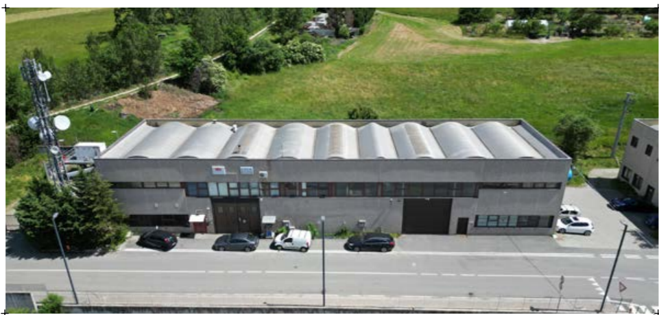
1// fotografia esterna del capannone industriale 2// fotografia frontale dell'edificio in oggetto