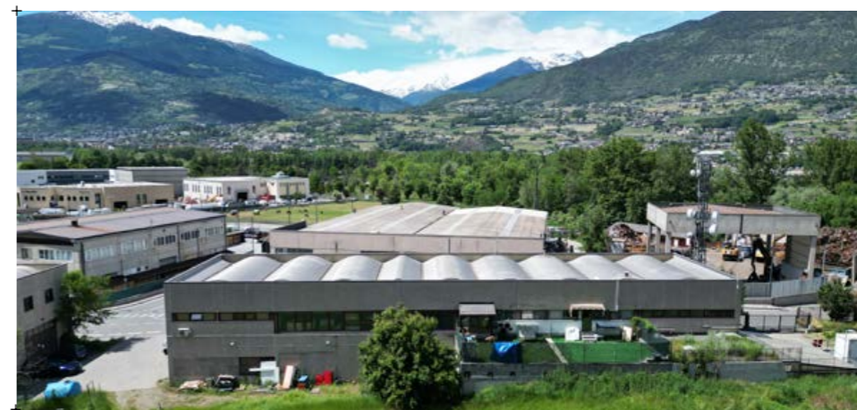
3// fotografia della testata dell'edificio