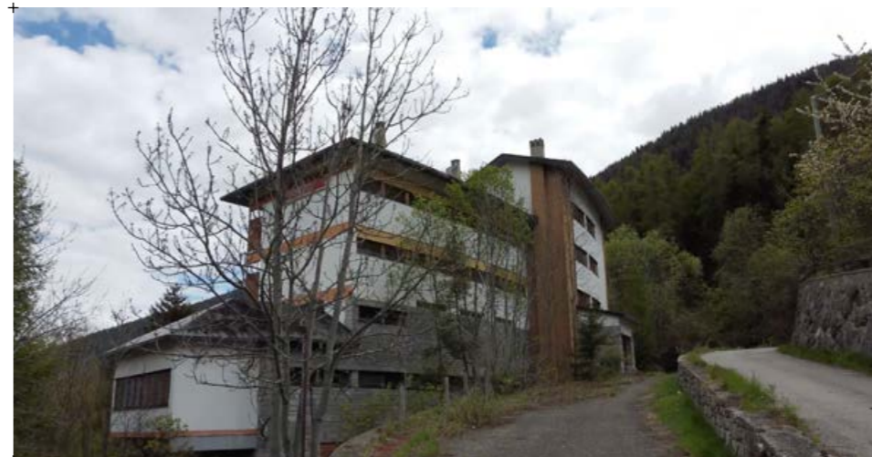
3// fotografia scattata al termine della salita in località Chevrières