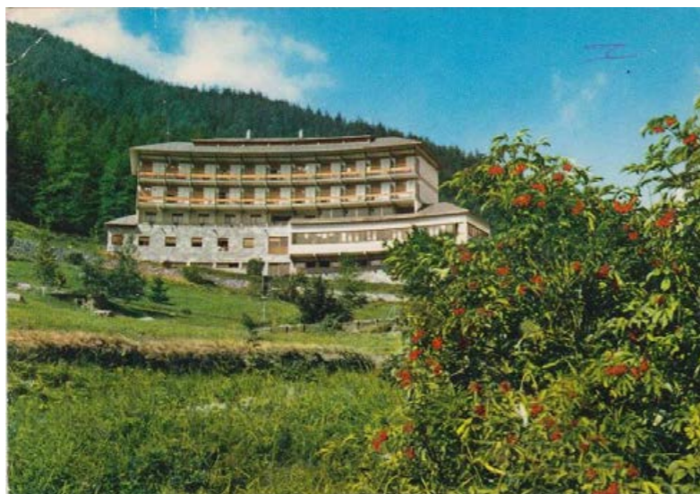
1// cartolina della struttura turistica firmata il 6 luglio 1977