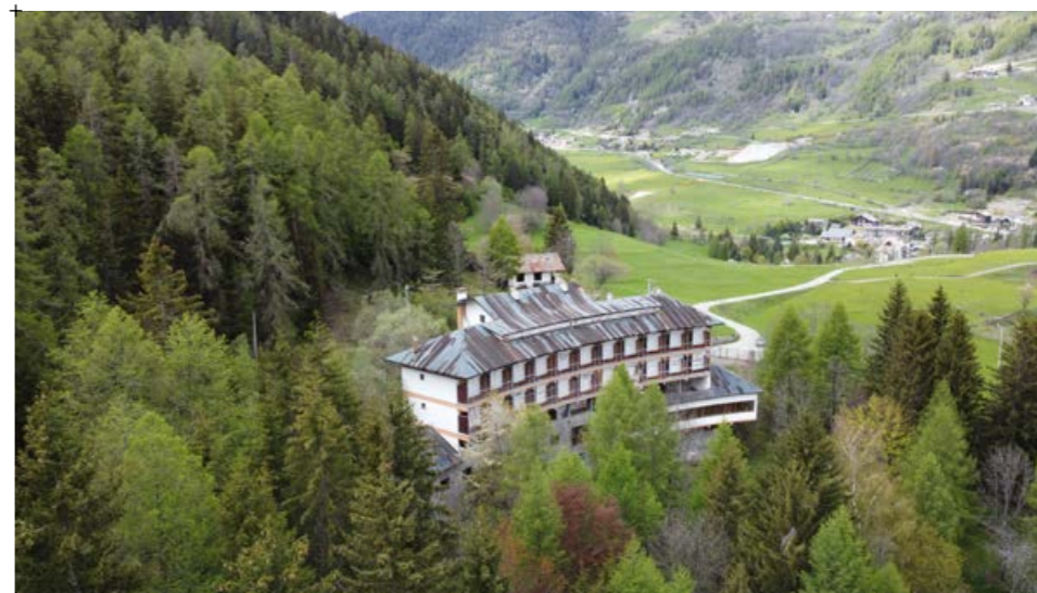
4// fotografia dell'edificio dove si vede il contesto naturale