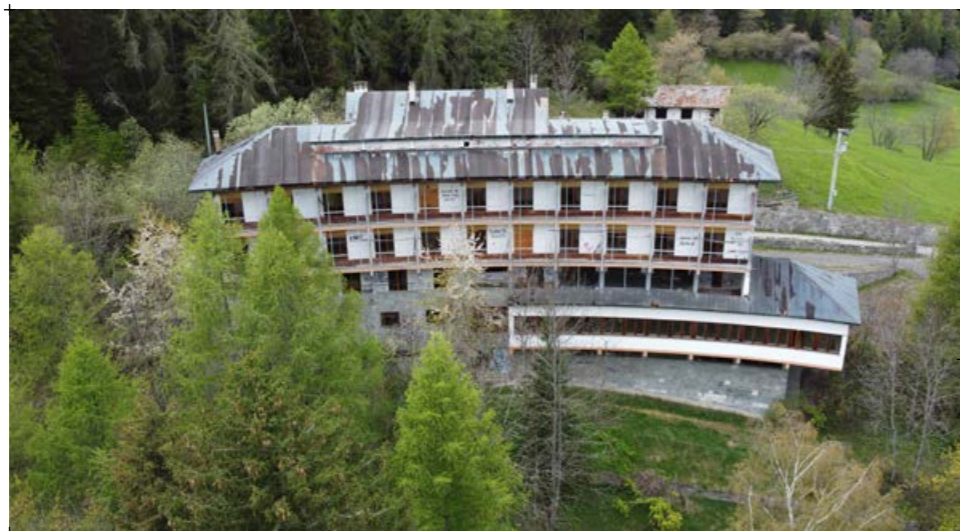
2// fotografia della porzione anteriore l'edificio. Si può notare la presenza di un corpo emergente orizzontalmente e la forma curvilinea dell'edificio