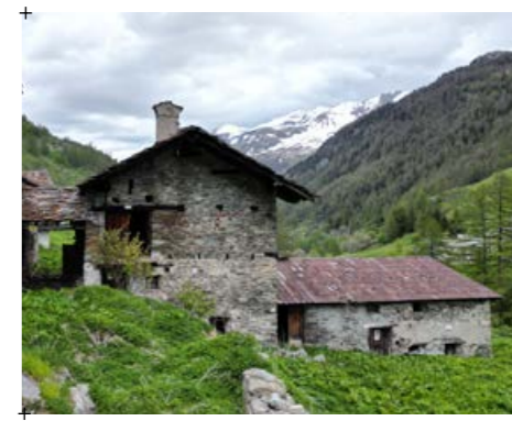
3// fotografia complessiva del villaggio Surier scattata da est verso ovest