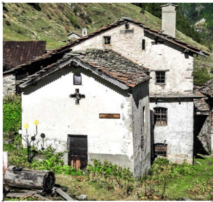
2// fotografia della chiesa del villaggio di Surier, Valgrisenche