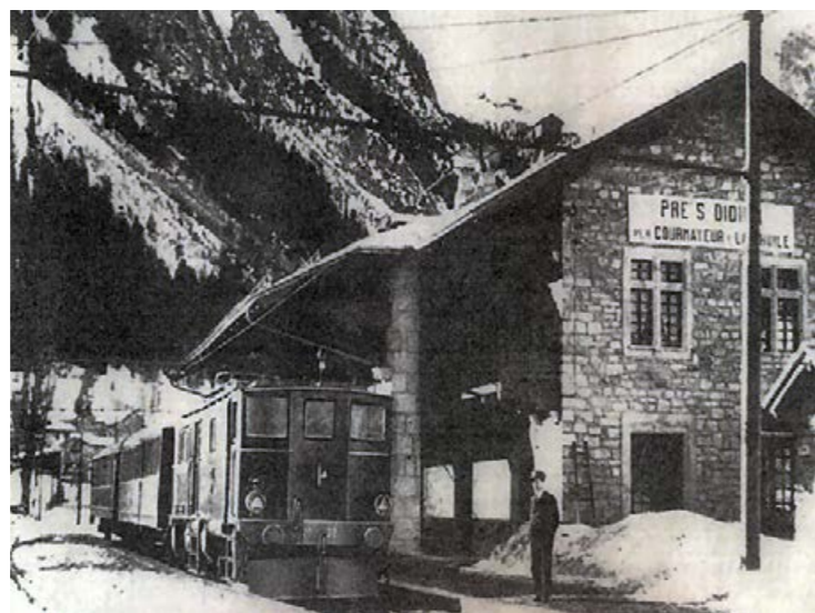
1// fotografia presa circa nel 1929, attorno all'inaugurazione della stazione.