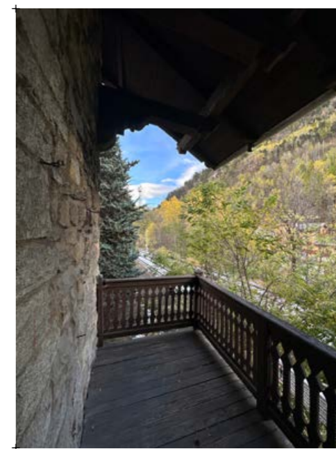
5// fotografia dell'edificio e gli spazi esterni